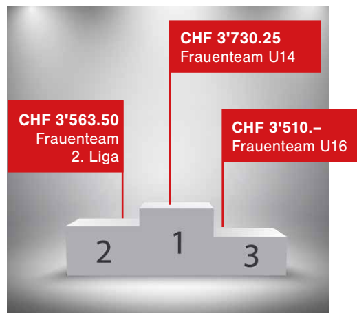
Die 3 Teams mit den grössten Sammelbeträgen.